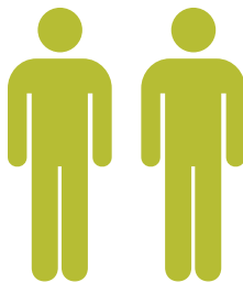
Frères et sœurs de patients atteints de FK